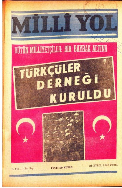
Milli Yol Dergisi 34. Sayısı Kapağı