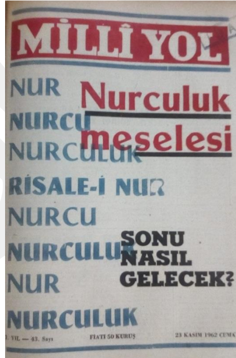
Milli Yol Dergisi 43. Sayı Kapağı