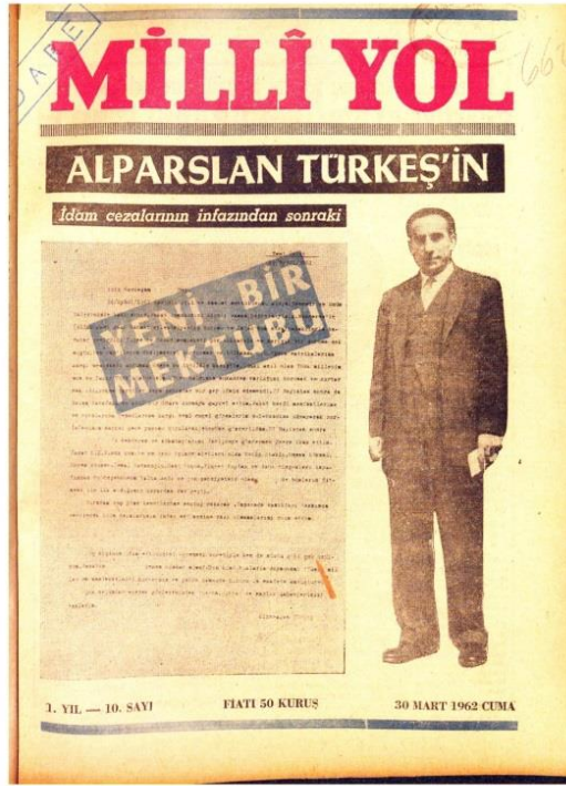
Milli Yol Dergisi 10. Sayısı Kapağı