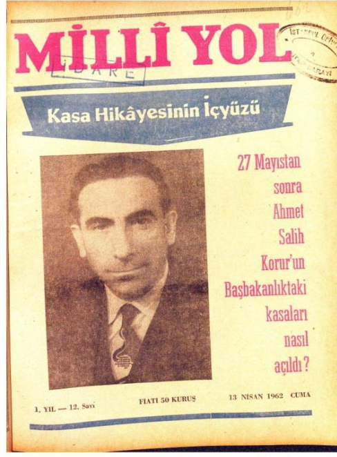
Milli Yol Dergisi 12. Sayısı Kapağı