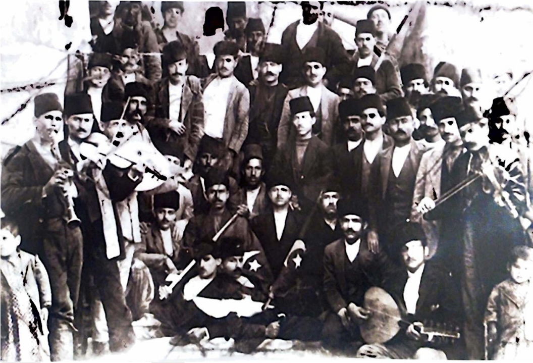
Resim 4: Talas'ta yaşayan Türk, Ermeni ve Rumlar II. Meşrutiyetin 1. yıldönümü kutlamalarında (1909)

Kayseri ve civarındaki halkın 19.yy. daki demografik profili ve sosyoekonomik durumu dikkate alındığında Amerikalı misyonerler bölgede yaptıkları faaliyetlerle her biri birbirine eklenmiş ve birbiri içine geçmiş çeşitli dini, siyasi ve kültürel kazanımlar hedeflemiştir. Bunların belli başlıları aşağıdaki gibi sıralanabilir: