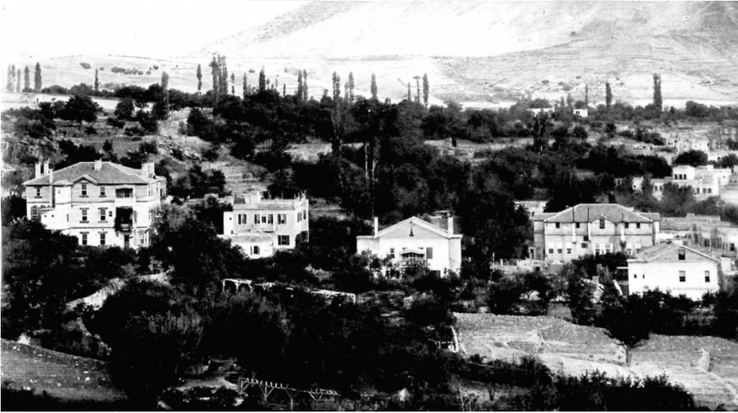
Resim 3. Okulun ilk yılları (soldan sağa) Amerikan Hastanesi, Lojmanlar ve Kız Okulu.

Amerikan Board'un Kayseri İstasyonu, 1854 yılında teşkilatın misyonerleri W. A. Farmsworth ile J. N. Ball tarafından kurulmuştur. Ancak Kayseri'de başlatılan ve yürütülen misyonerlik faaliyetleri, yazları havanın oldukça sıcak olması nedeniyle 1859 yılından itibaren kent merkezine yakınlığıyla bilinen ve havanın nispeten daha serin olduğu Talas kasabasına taşınmaya başlamıştır. Misyonerlik faaliyetlerine Kayseri'den ziyade Talas'ta ağırlık verilmeye başlanınca 1866'da dış istasyon konumunda olan Talas ilerleyen dönemlerde merkez istasyon konumuna dönüşmüş ve 1972 yılına kadar da faaliyetine devam etmiştir (Kozlu, 2019, s. 1629-1631). Amerikan Board Talas istasyonunda ağırlıklı olarak din, eğitim ve sağlık alanlarında faaliyet göstermiş ve bu kapsamda Talas'ta hastane, okul ve ibadethaneler açmıştır. Amerikalı misyonerlerin Talas'ta açtığı okullardan biri de Amerikan Kolejidir. Bu okul, kuruluşundan kapanışına kadar çeşitli aşama ve değişikliklerden geçerek hem Osmanlı Devleti hem de Türkiye Cumhuriyeti Devleti dönemlerinde bölge halkına eğitim hizmeti vermiştir.